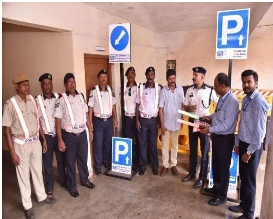
PROMOTION OF ROAD SAFETY