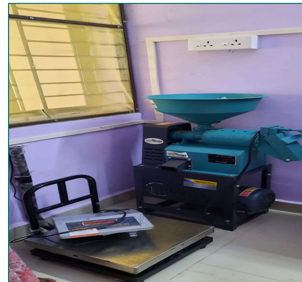
MACHINERIES AT MULTIPRODUCT PROCESSING CENTRE, SANQUELIM