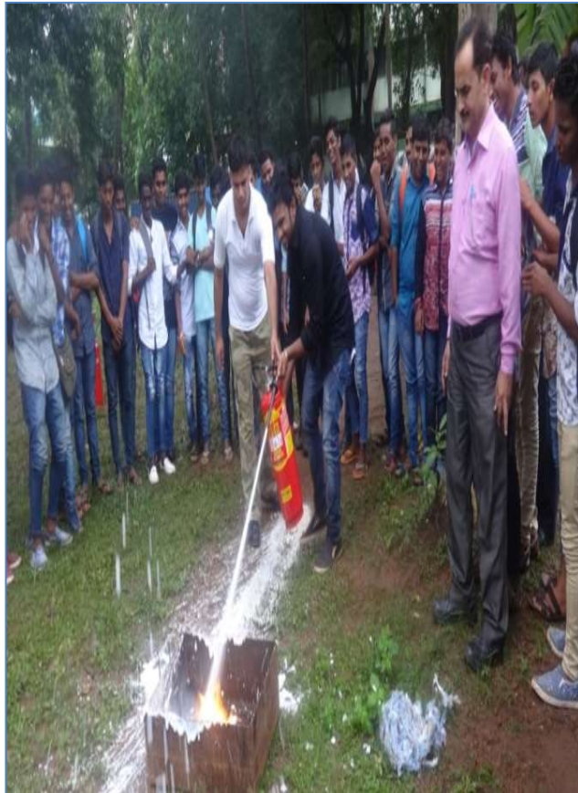
TRAINING ON FIRE SAFETY