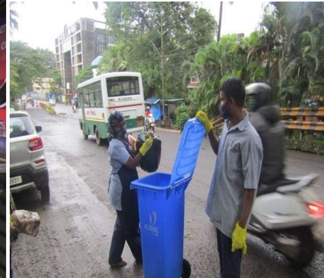
REGULAR CLEANING OF ROAD FROM ST. ANDREW CIRCLE, VASCO TO AIRPORT JUNCTION, CHICALIM