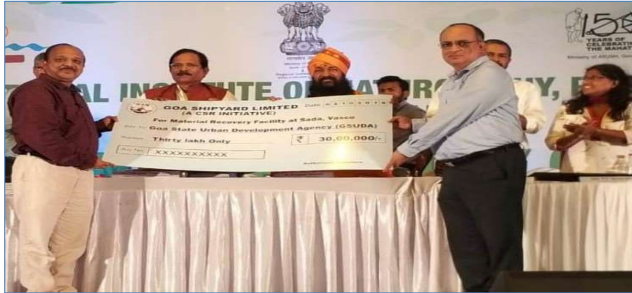
HANDING OVER OF CHEQUE TO GOA STATE URBAN DEVELOPMENT AGENCY FOR ESTABLISHMENT OF MRF FACILITY IN VASCO