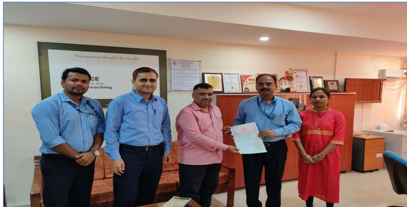
SIGNING OF MOA WITH GOA STATE BIODIVERSITY BOARD FOR ESTABLISHMENT OF MULTIPRODUCT PROCESSING CENTRE