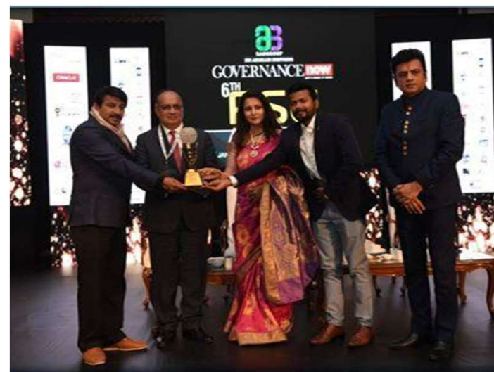
6TH PSU GOVERNANCE NOW AWARD