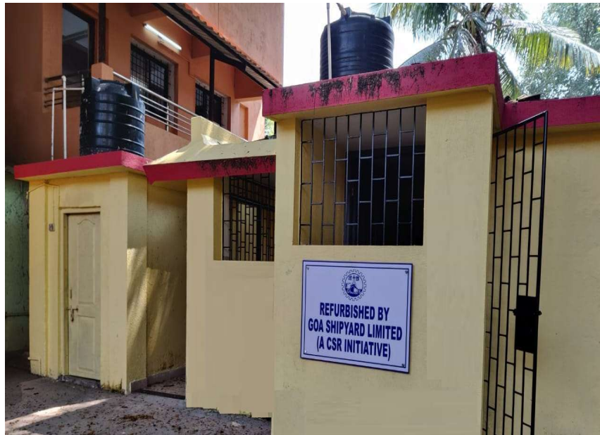
RENOVATED TOILET BLOCKS AT GOVERNMENT HIGH SCHOOL (MAIN), VASCO