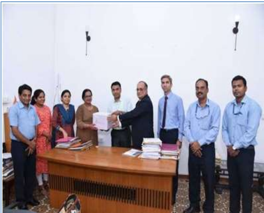
BREAST CANCER SCREENING EQUIPMENT TO DIRECTORATE OF HEALTH SERVICES, GOA