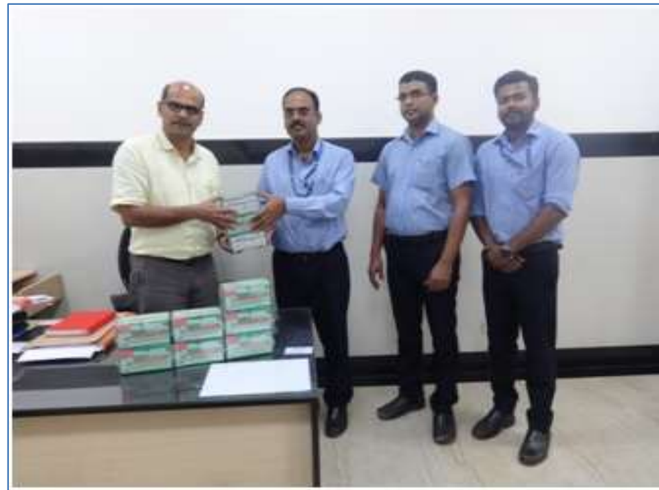
DENGUE KITS TO SUB-DISTRICT HOSPITAL, CHICALIM