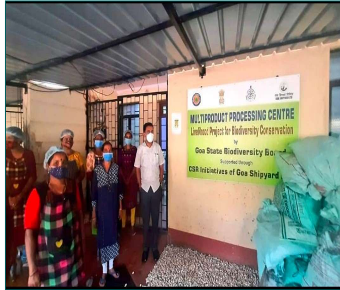
MULTIPRODUCT PROCESSING CENTRE AT SANQUELIM