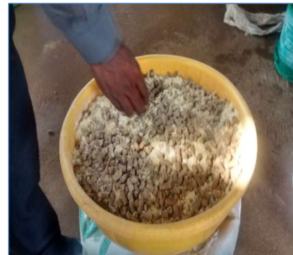
FODDER FOR CATTLE