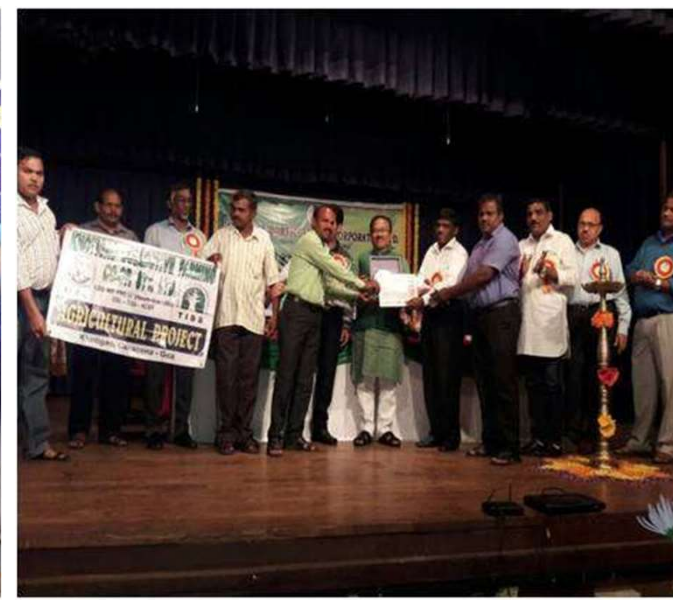
BEST VEGETABLE GROWING INSTITUTION AWARD