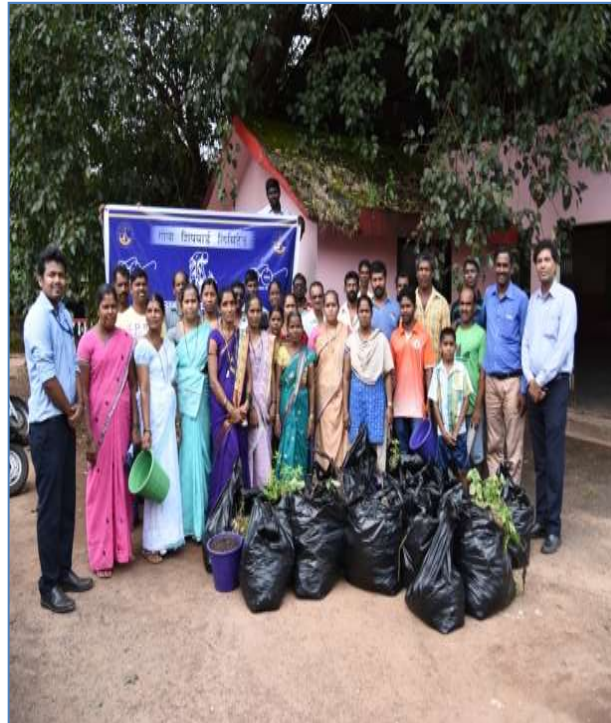
"SWACHHATA HI SEWA" CAMPAIGN