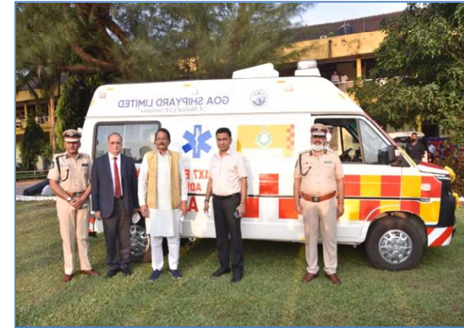
ADVANCED LIFE SUPPORT AMBULANCE TO GOA POLICE