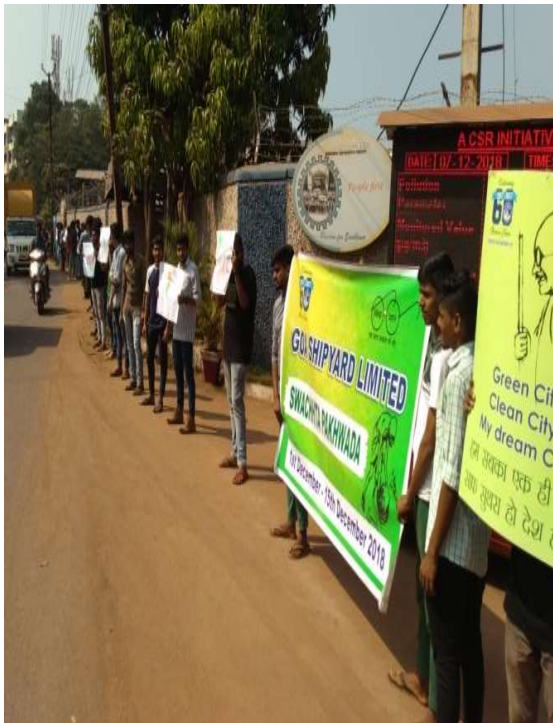
HUMAN CHAIN ON SWACHHTA AWARENESS