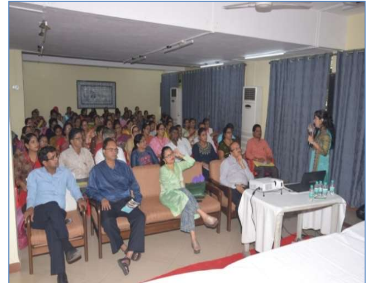
TEACHERS TRAINING PROGRAMME ON ORAL HEALTH AND HYGIENE