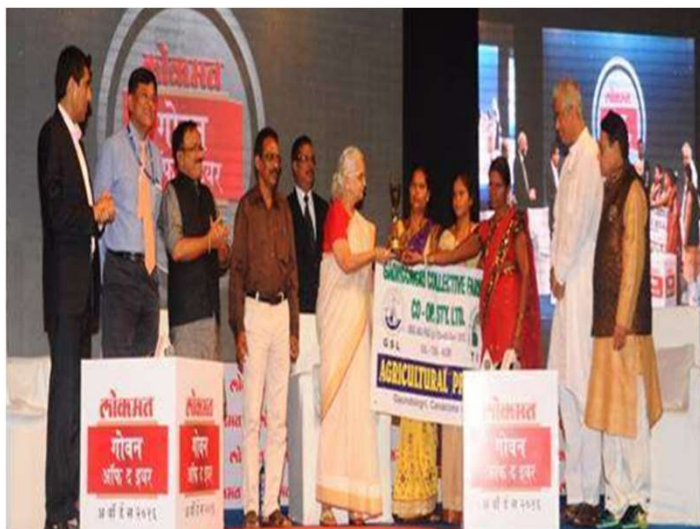
LOKMAT GOAN OF THE YEAR AWARD 2016 FOR AGRICULTURE PROJECT