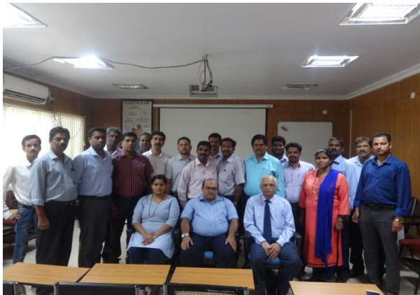
TRAIN THE TRAINER PROGRAMME FOR GOVT. ITI INSTRUCTORS