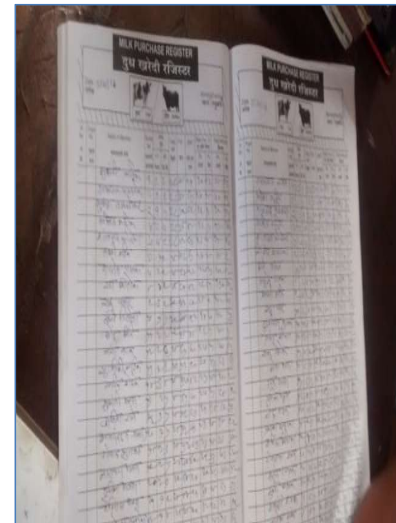
MILK PURCHASE REGISTER