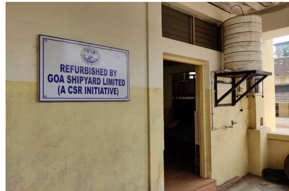
RENOVATED TOILET BLOCKS AT MUNICIPAL HIGH SCHOOL, VASCO