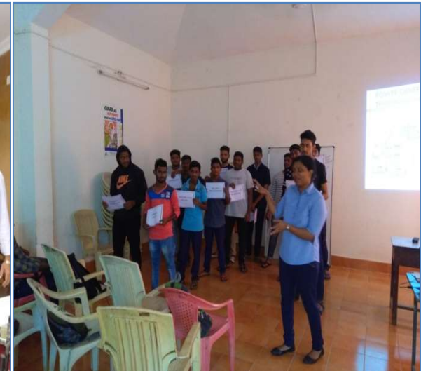
TRAINING ON SOFT SKILLS BY GSL EXECUTIVE