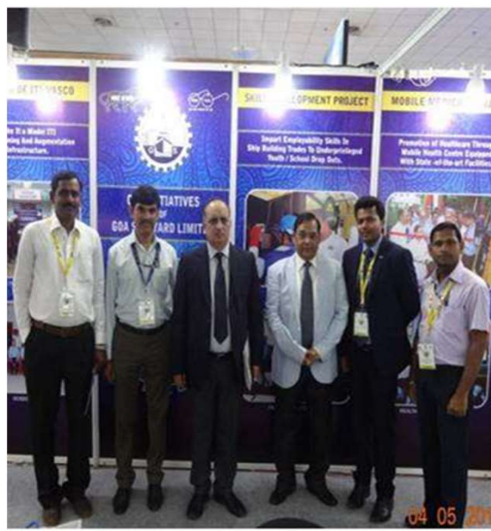
GSL PARTICIPATION AT CSR FAIR