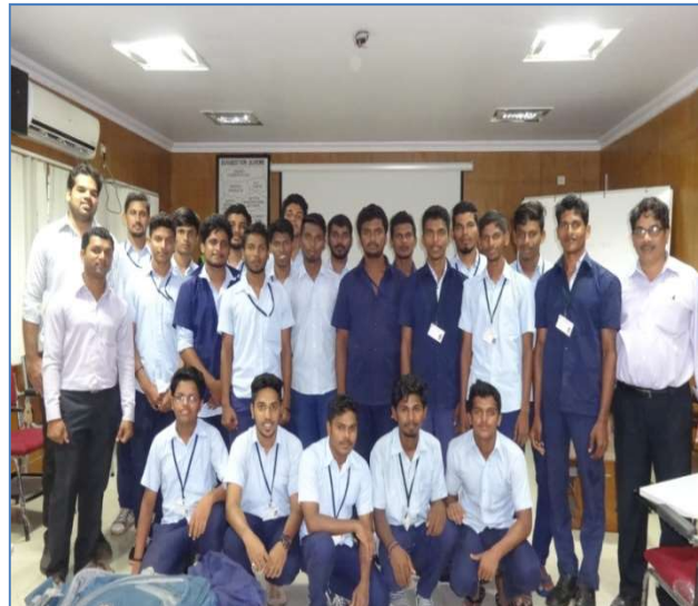
ON THE JOB TRAINING IN GSL