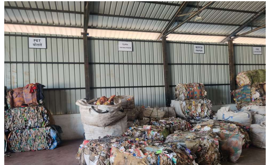
SORTING AND SEGREGATING WORK IN PROGRESS