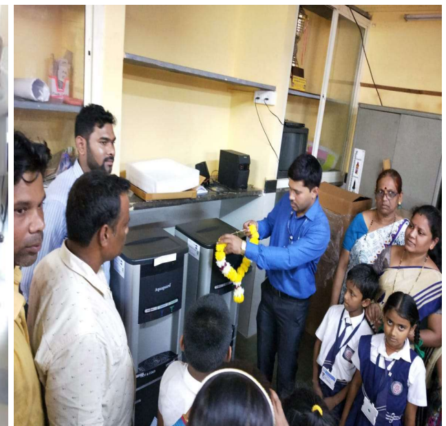
SAFE DRINKING WATER FACILITY FOR SCHOOL CHILDREN