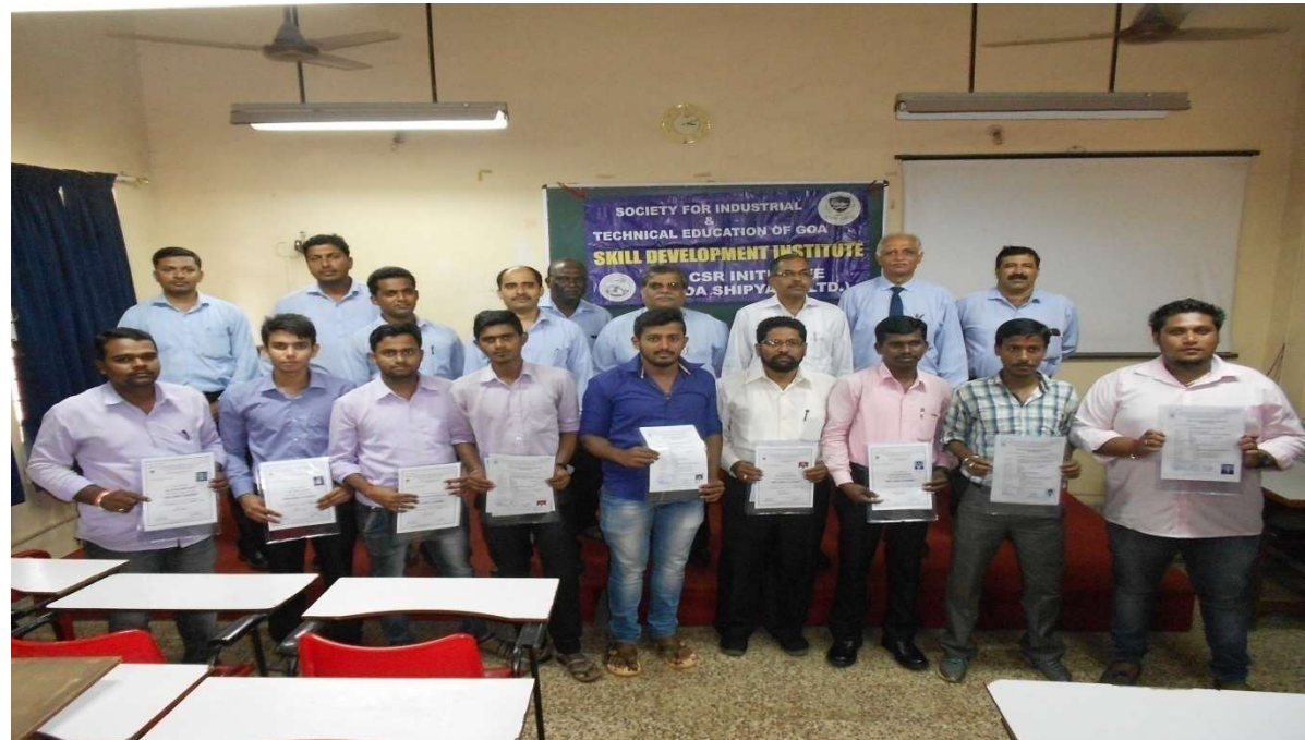
PASSING OUT FUNCTION