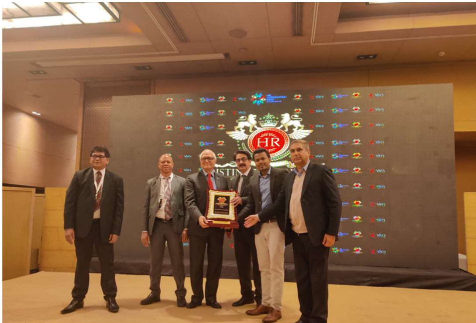
1st POSITION FOR "MOST EFFECTIVE CSR STRATEGY" BY HR ASSOCIATION INDIA