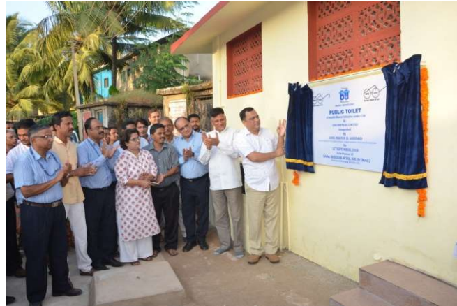
INAUGURATION OF PUBLIC TOILET AT NEW VADDEM, VASCO