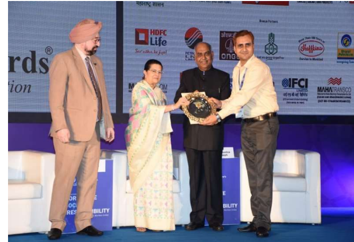
GOLDEN PEACOCK AWARD FOR CORPORATE SOCIAL RESPONSIBILITY FOR THE YEAR 2019