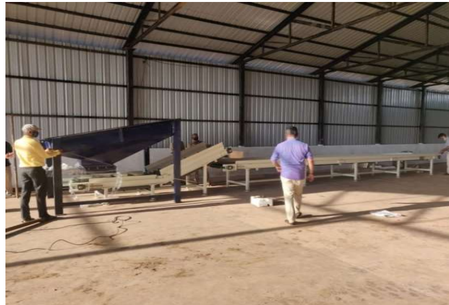
MATERIAL RECOVERY FACILITY (MRF) SHED AT SADA, VASCO