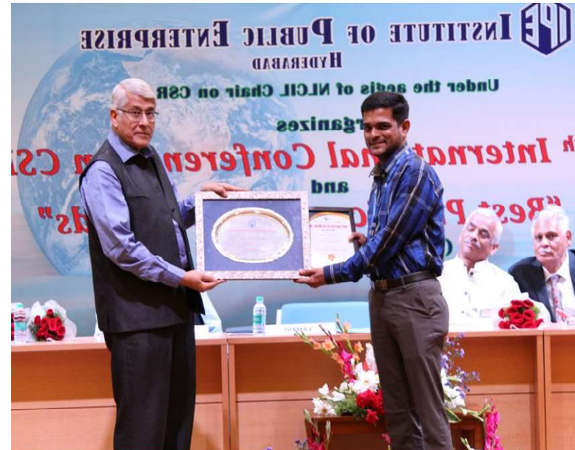
BEST SKILL DEVELOPMENT PROJECT BY IPE, HYDERABAD