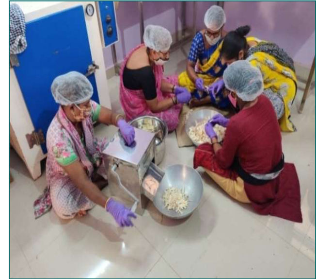
MAKING OF JACKFRUIT CHIPS BY TRIBAL WOMEN