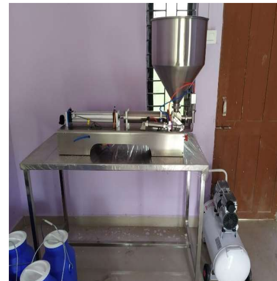
MULTIPRODUCT PROCESSING CENTRE AT SANQUELIM, GOA