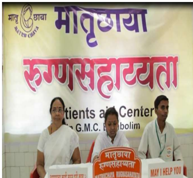
FACILITATING MEDICAL SUPPORT AT GOA MEDICAL COLLEGE, BAMBOLIM IN COLLABORATION WITH MATRUCHHAYA