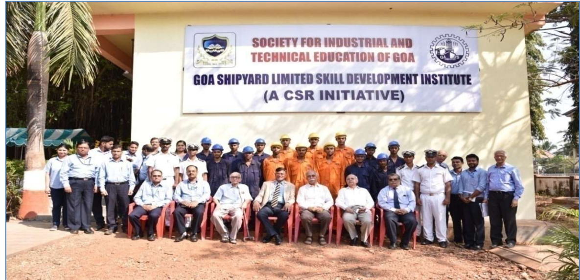
INAUGURATION OF CENTRE OF EXCELLENCE