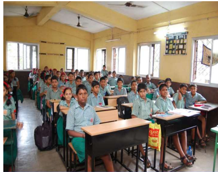
EDUCATIONAL AID SUPPORT FOR PROMOTING EDUCATION