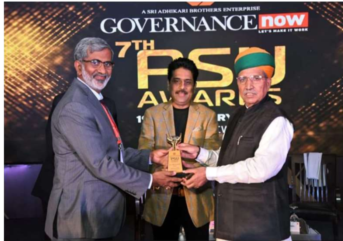
7TH PSU GOVERNANCE NOW AWARD FOR SWACHH BHARAT UNDER CSR