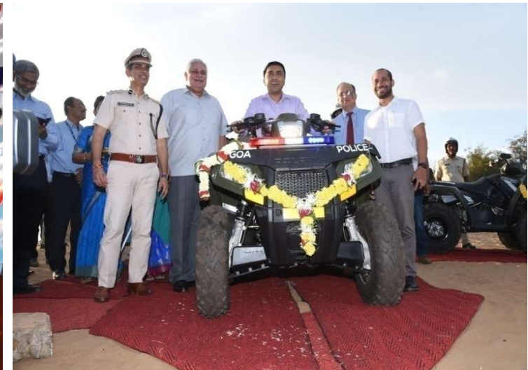
ATVS TO GOA POLICE FOR COASTAL SECURITY