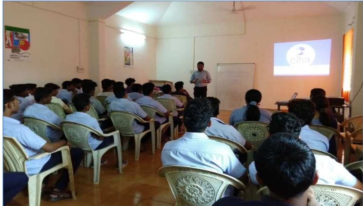
ENTREPRENEURSHIP DEVELOPMENT PROGRAM BY CIBA FOR VASCO ITI STUDENTS