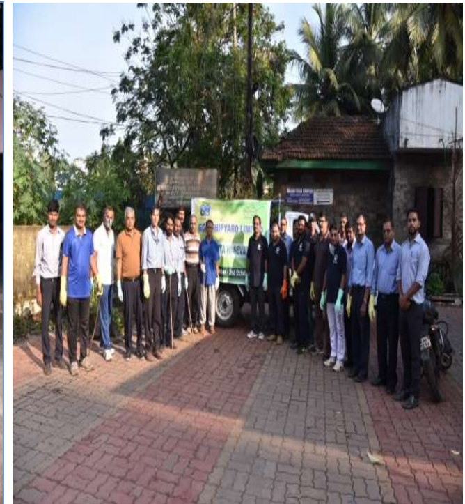
CLEANLINESS DRIVE ON GANDHI JAYANTI