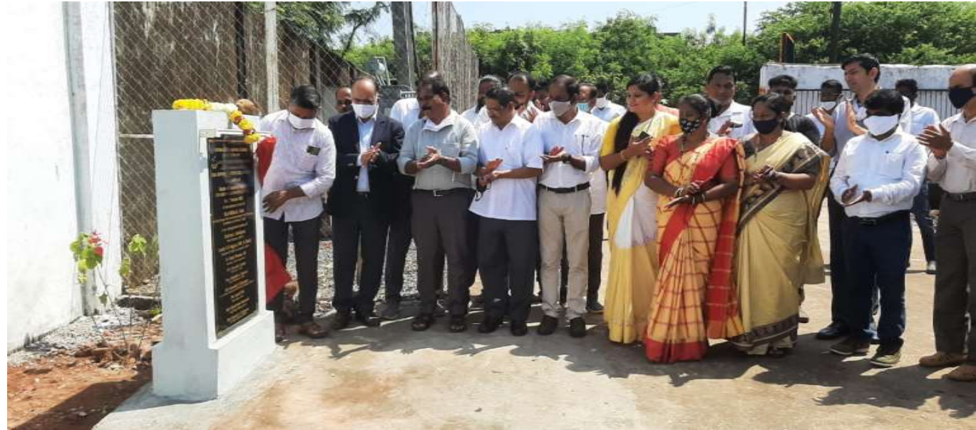
SUPPORT TOWARDS ESTABLISHMENT OF MRF FACILITY (WASTE MGT.) AT SADA, VASCO