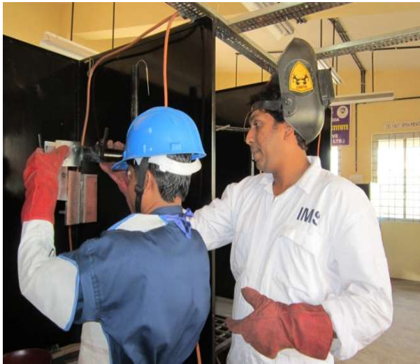
TRAINING IN PROGRESS