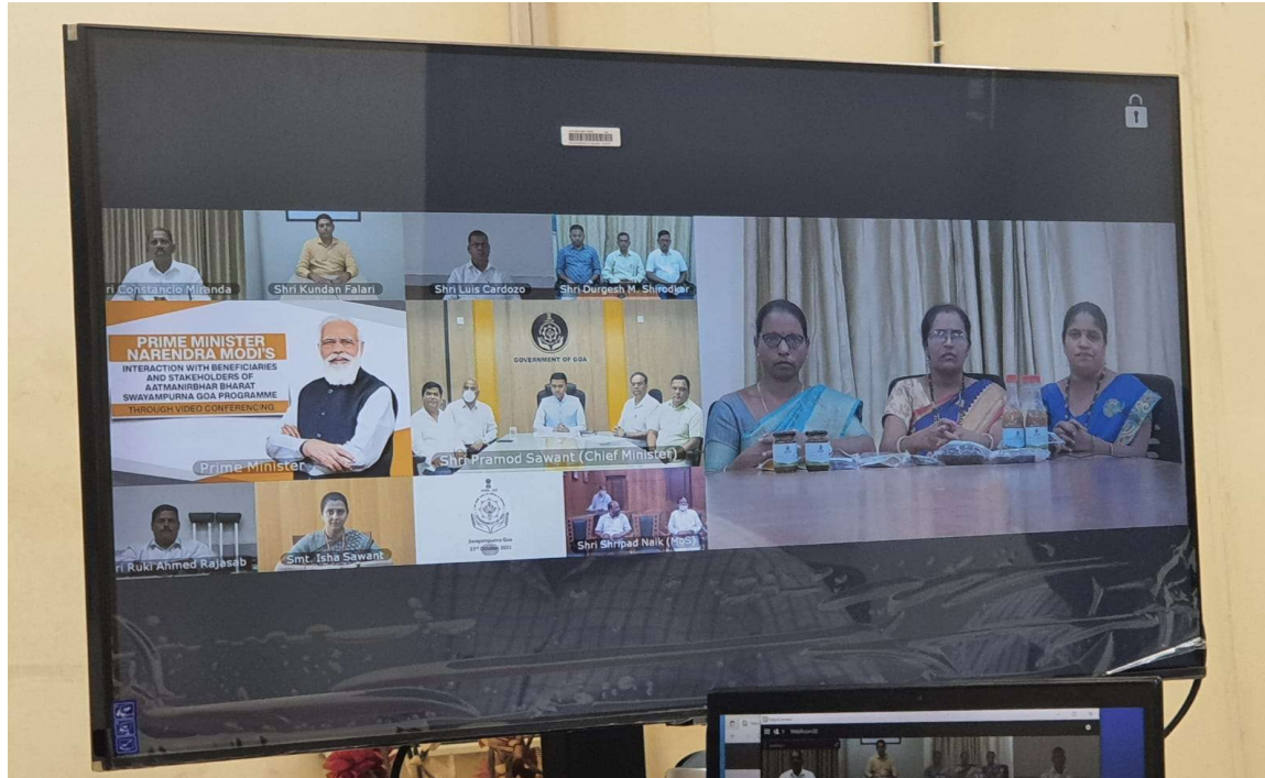
LIVE INTERACTION WITH HON'BLE PRIME MINISTER OF INDIA ON MANN KI BAAT PROGRAMME